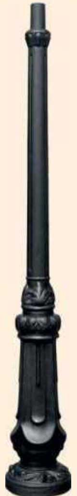
słup S-21W/A, układ ramion 2 w górę, oprawy OP E/Z/400, klosze Kule mrożone Ø 400